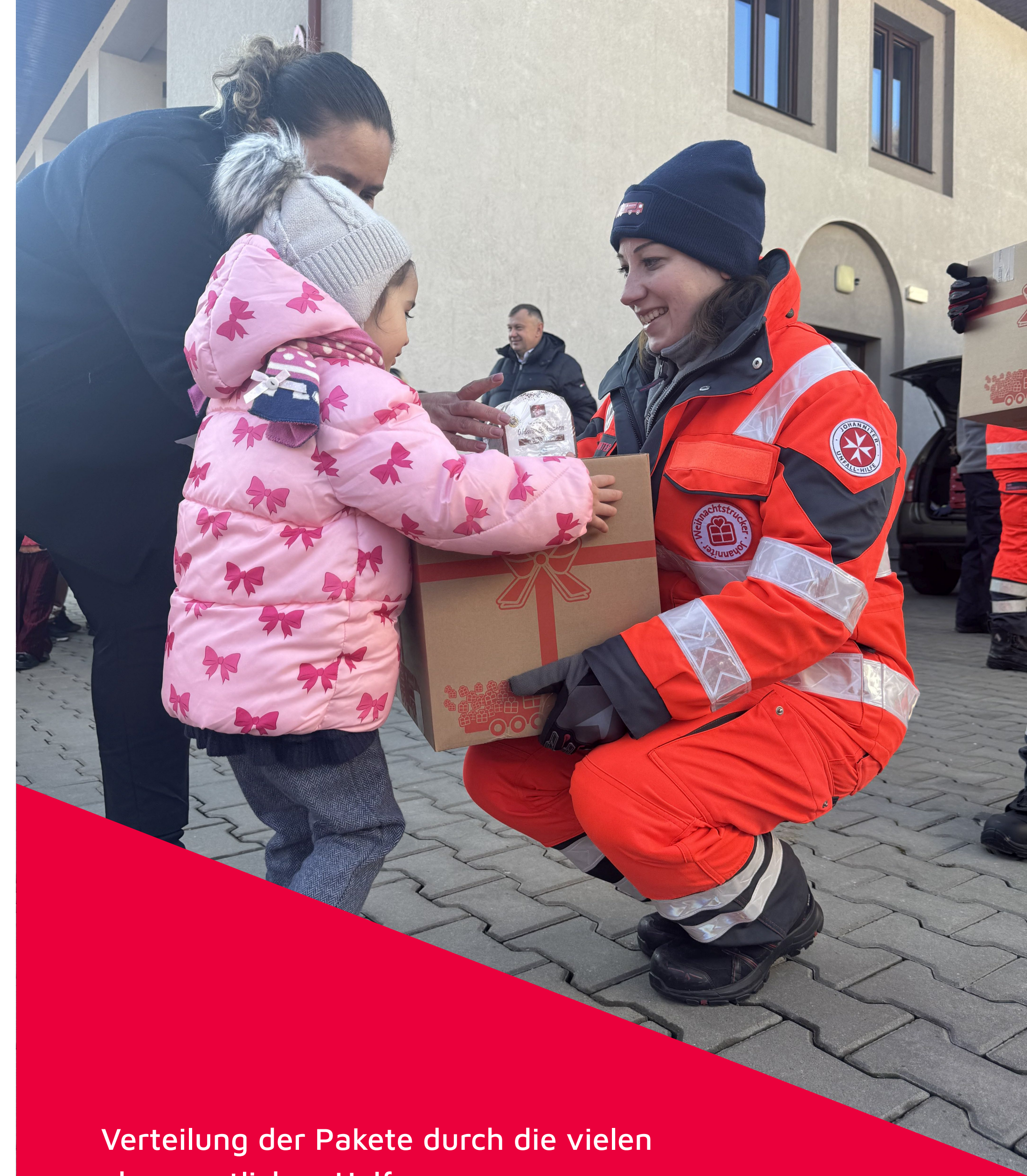
Verteilung der Pakete durch die vielen ehrenamtlichen Helfer