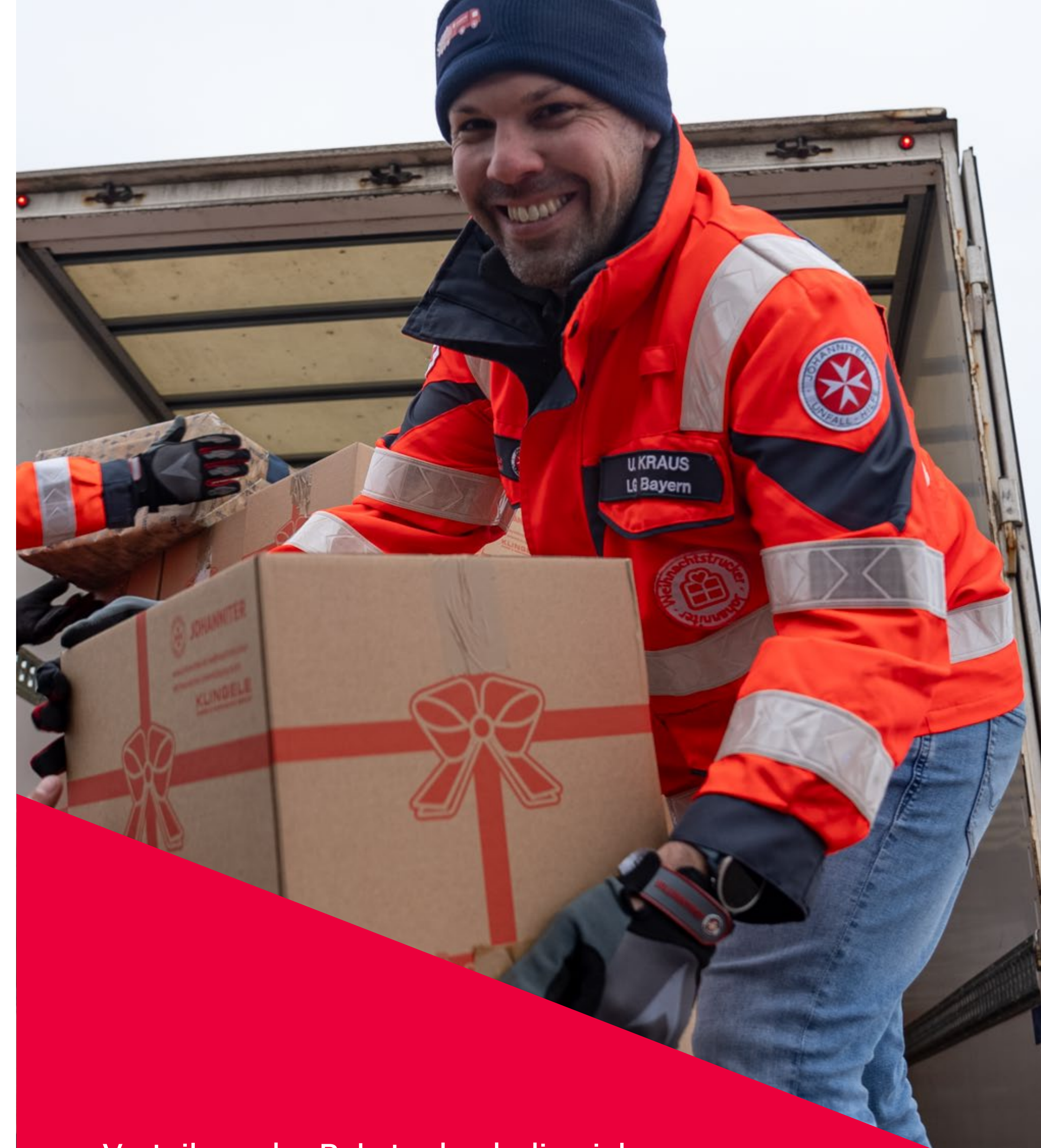
Verteilung der Pakete durch die vielen ehrenamtlichen Helfer